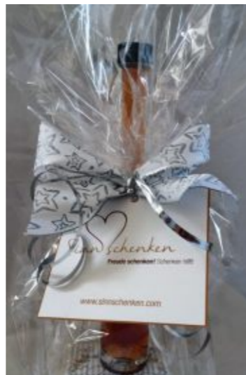
Liebevolle Verpackung von einzigartigen Geschenken.

den Angeboten „Stationäres Kinderhospiz“ und „Ehrenamtliches Kinderhospiz-Team“ mit umfangreichem Therapie- und Betreuungsangebot für Familien mit sterbenskranken und chronisch kranken Kindern. Die Einrichtung steht Familien aus ganz Österreich offen. ■ Besuchen Sie den Verein Agora bis 23. Dezember an jedem Freitag und Samstag am Weihnachtsmarkt Hallein. Neben den besonderen Geschenkideen wartet auch eine große Advent-Tombola mit wertvollen Preisen – jedes Los gewinnt! www.sinnschenken.at ■